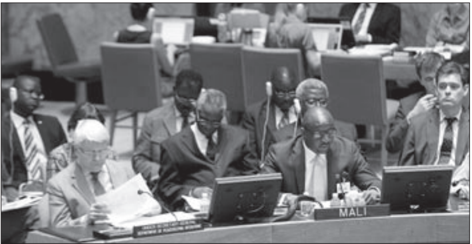
Beratung zur Situation in Mali im UN-Sicherheitsrat am 25.06.2013